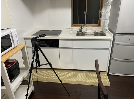
図 2: 実験環境